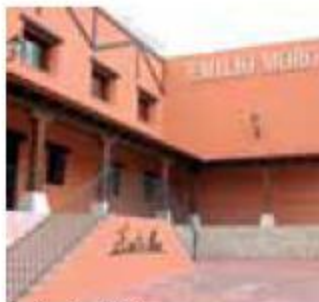
Bodega Emilio Moro Emilio Moro Wine Cellar