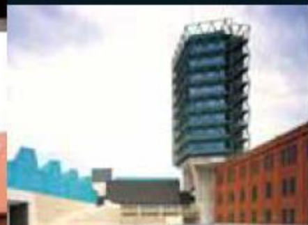
Museo de la Ciencia de Valladolid Valladolid Science Museum