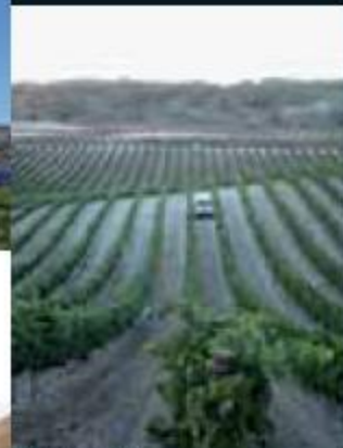
Rutas en 4x4 Routes with 4x4