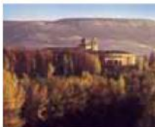
Valbuena de Duero