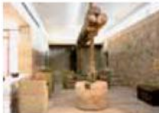
Lagar Lavida Old Winepress Lavida