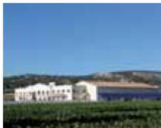
Centro de Interpretación Vitivinícola Emina Emina Wine Interpretation Centre