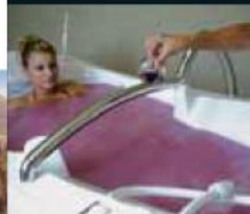
Spa-Vinoterapia Lavida Wine-spa Lavida