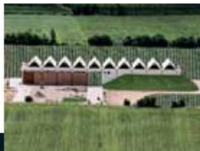
Bodegas Lleirosso Lleirosso Wine Cellar