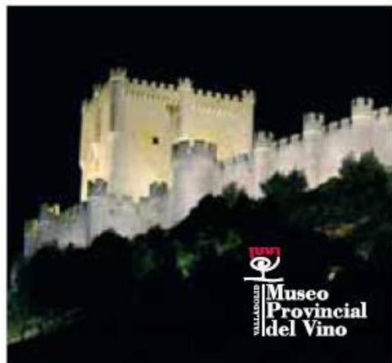
Castillo de Peñafiel. Museo del Vino Peñafiel Castle. Wine Museum

AEROPUERTO (airport) DE VALLADOLID: +34 983 415 500 ESTACIÓN DE AUTOBUSES (bus station): +34 983 236 308 ESTACIÓN DE TRENES (train station): +34 902 240 202 RADIO TAXI: +34 983 291 411 / +34 983 205 577