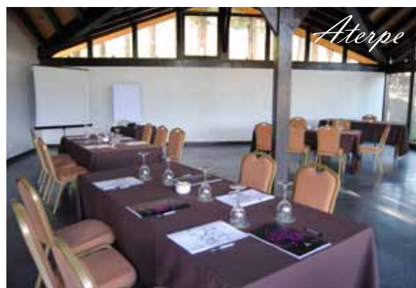
100 m2 100 personas en cóctel