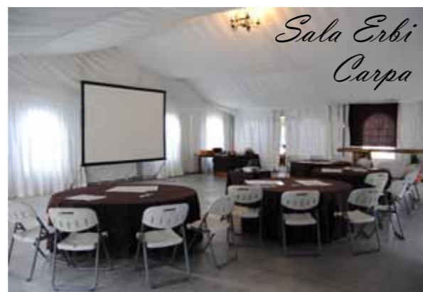
120 m2 100 personas en cóctel