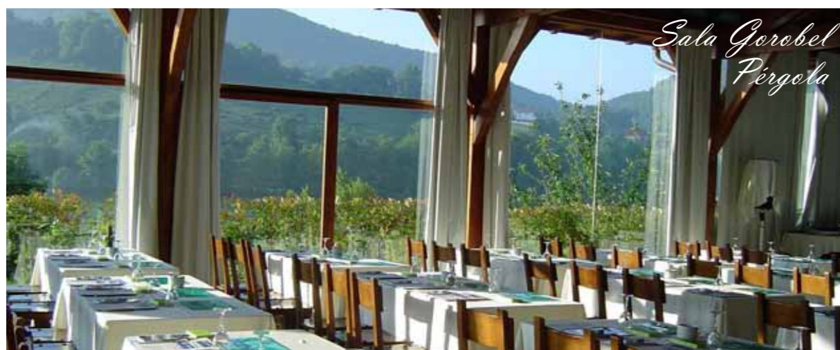
200 m2 180 personas en cóctel